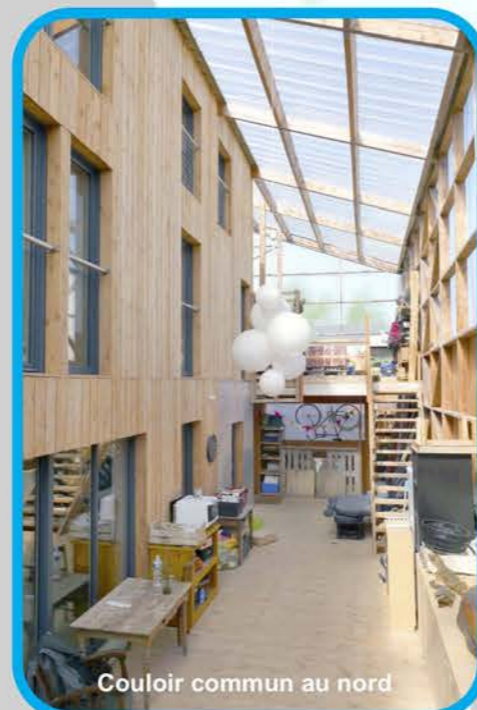
Couloir commun au nord

Créations de l'architecte DPLG Cécile Gaudouin (Rennes) www.cecilegaudouin.com