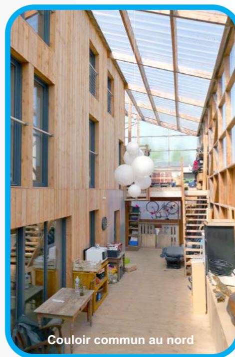
Couloir commun au nord

Créations de l'architecte DPLG Cécile Gaudouin (Rennes) données en exemple www.cecilegaudouin.com